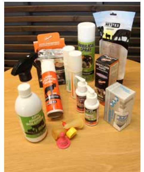
Margar gagnlegar og góðar vörur fyrir sauðburðinn má fá í verslun Bústólpa.