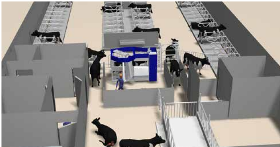
Ráðgjöf við mjólkurframleiðendur er mikilvægur hluti DeLaval-þjónustu Bústólpa og eru gerðar privíddarteikningar af hugmyndum um skipulag í fjósum, bæði þegar um nýframkvæmdir er að ræða og breytingar. Hér má sjá dæmi um slíka teikningu og er mjaltþjónn DeLaval fyrir miðju.

„Við höfum mjög góða reynslu af DeLaval mjaltþjónunum og að öllum þáttum samantöldum þá er sú leið hagstæður kostur, sér í lagi miðað við þá gengisþróun sem hefur verið að undanförmu. Sérstafa DeLaval mjaltþjónanna er mikil. Einstök hönnun mjaltarmsins gerir að verkum að hægt er að grípa