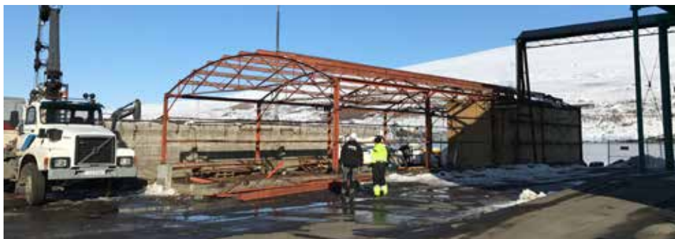
Gamall braggi á lóð Bústólpa var á dögnum rifinn og í stað hans koma ný fóður- og hráefnissiló.