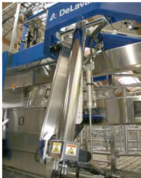
DeLaval mjaltapjónn á bænum Hóli í Sæmundarhlíð í Skagafirði.

sem þrívíddarmyndum ef þess er óskað. Þegar síðan á framkvæmdastigið er komið sjáum við um uppsetningu DeLaval-búnaðarins og sé t.d. um að ræða mjaltapjóna eins og er algengast í dag þá fylgjum við uppsetningu og frágangi eftir með kennslu á búnaðinn og svo reglubundnum þjónustuskoðunum. Með öðrum orðum fylgjum við verkefni bóndans eftir allt frá hugmyndastigi yfir í framleiðslustig,” segir Stefán.